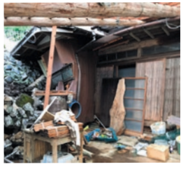
土砂につぶれそうな家屋 (相模原市緑区)